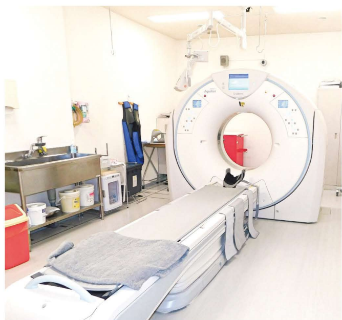
80列マルチスライスCT装置

CT装置は、80列マルチスライスCT装置となり、旧装置よりも撮影時間が大幅に短縮され、X線被曝を低減しながらもより細かい高画質な画像を提供することが可能となりました。